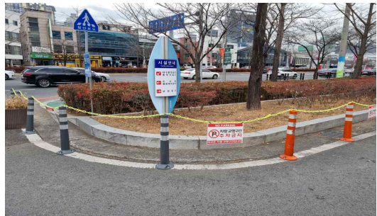
연번5 공원 화장실 입구 시각장애인용 보도블럭 노후