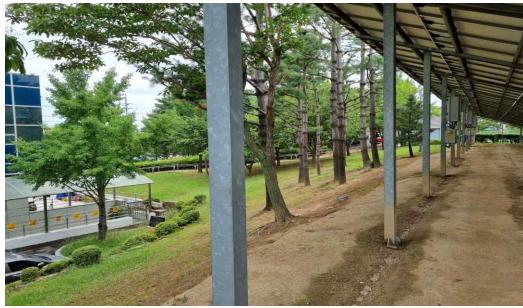
연번1 | 상화동산 태양광설비 진입 위험